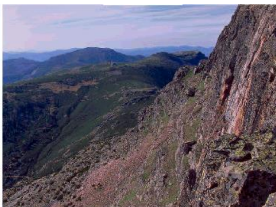
sierra de Francia

biodiversidad de su sotobosque y su complejo florístico.