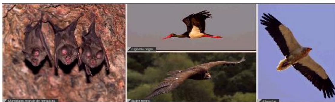
murciélago grande de herradura, cigüeña negra, buitre negro, alimoche

En cuanto a la fauna ocurre una situación parecida, existiendo una gran diversidad de especies ligadas a esta complejidad de ecosistemas. Entre los peces, cabría destacar a Cobitis vettonica que es endémico de la Cuenca del