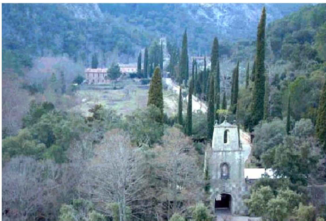
monasterio Carmelita de San José, valle de Las Batuecas

Tras una repoblación hecha por Alfonso VI, durante la cual se asentaron numerosos franceses que dan nombre a la Sierra, se suceden diversos reinados, destacando la presencia de templarios y judíos. Tras la expulsión de éstos por parte de los Reyes Católicos se sucede la construcción de numerosos